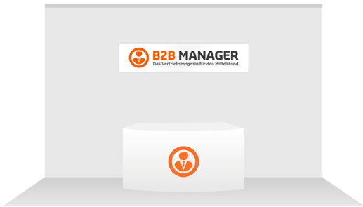
Beispiel Messestand: Kopfstand