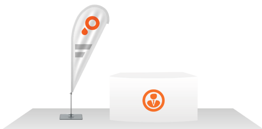
Beispiel Messestand: Blockstand