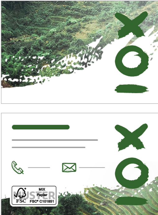
FSC®-Label Platzierung: Rückseite, unten links